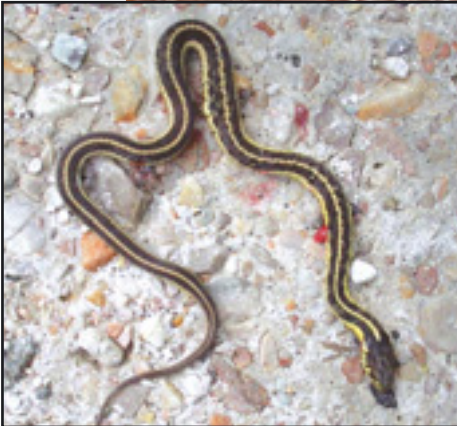
50 milyon yıllık yılan fosili (üstte)

(Yanda) Milyonlarca yıl önceki haliyle tıpatıp aynı olan günümüz yılanı görülmektedir.