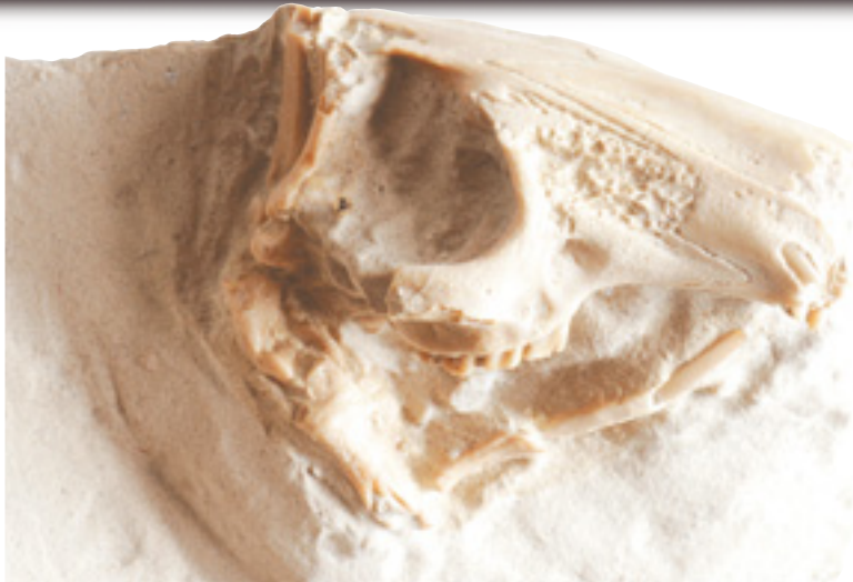
33 milyon yıllık tavşan kafatası fosili

Örümceklerin hep örümcek, arıların hep arı, vatozların hep vatoz olması gibi tavşanlar da hep tavşan olarak var olmuşlardır. Evrimin geçersizliğini gösteren sayısız fosil bulgusu karşısında, Darwinistlere düşen yenilgiyi kabul etmektir. Resimdeki 33 milyon yıllık tavşan fosili de, Darwinistlerin yenilgisini bir kez daha vurgulamakta, tüm canlıları Rabbimiz olan Allah'ın yarattığı gerçeğini göstermektedir.