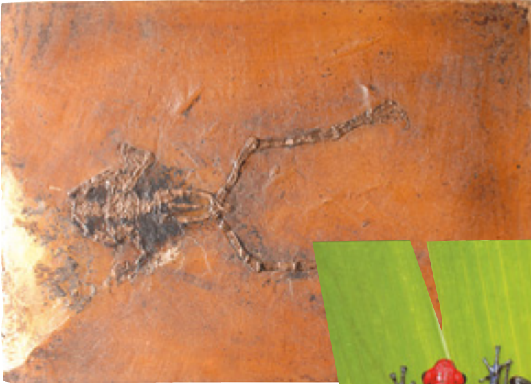
(Yukarıda) 50 milyon yıllık kurbağa fosili.

Bu kurbağa cinsinin bir kısmı arka ayaklarıyla toprağı kazarak toprak içerisinde, bir kısmı da sulu ortamlarda yaşar. Darwinistler amfibiye'nlerin sözde atasının balıklar olduğunu iddia ederler. Ancak bu iddialarını delillendirebilecek hiçbir bulguları yoktur. Tam tersine bilimsel bulgular, iki tür arasında çok büyük anatomik farklılıklar olduğunu ve birinin diğ'erinden türemiş olmasının imkansız olduğunu göstermektedir. Bu bilimsel bulgulardan biri de fosil kayıtlarıdır.