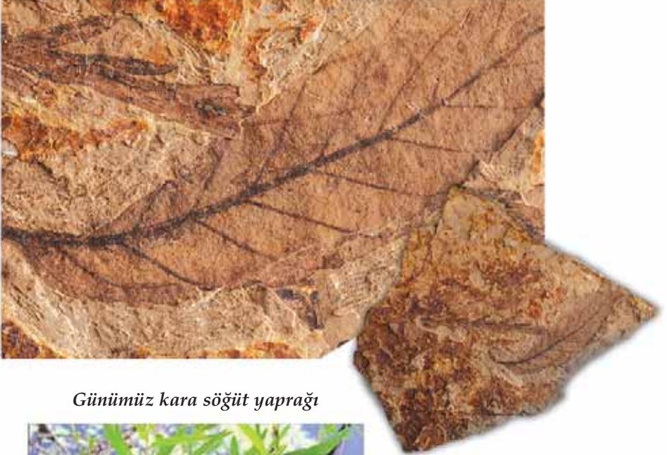
Günümüz kara söğüt yaprağı