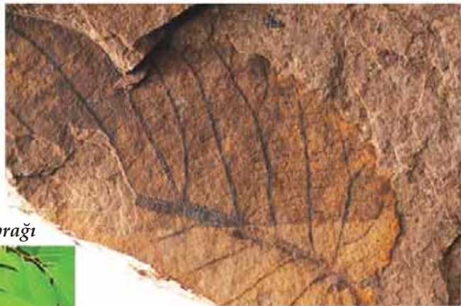
Günümüz keaki yaprağı