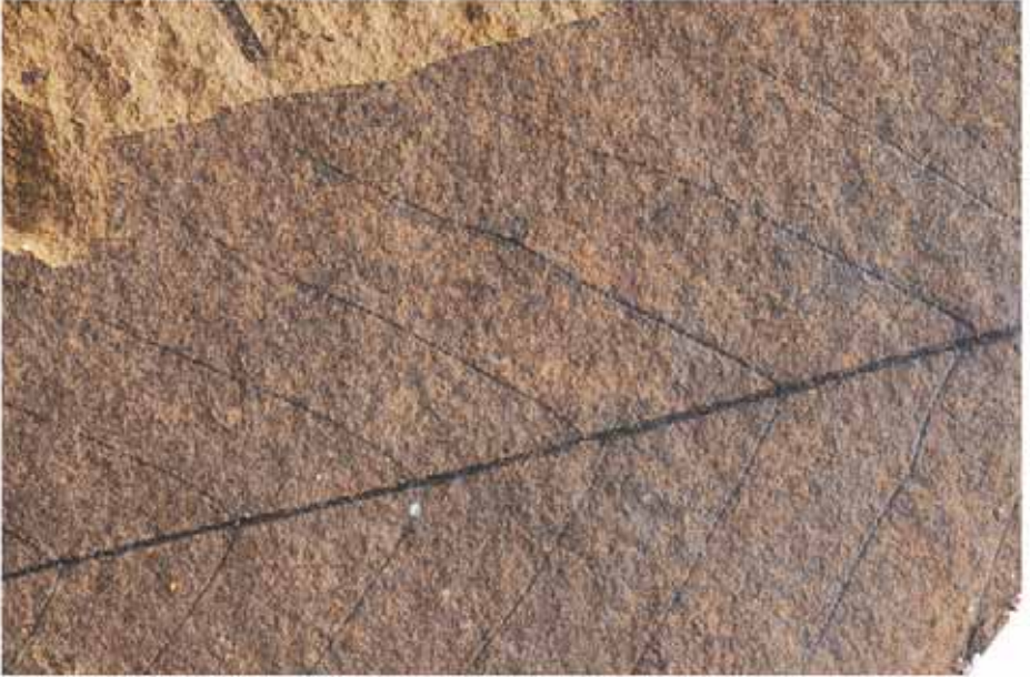
Altta günümüz akdiken yaprağı

Darwinistler, hayvanlar aleminin fosil kayıtlarındaki deęişmezlięini açıklayamadıkları gibi, bitkiler alemindeki deęişmezlięi de açıklayamazlar. Binlerce hayvan türünün yanında, sayısız bitki türü de fosil kayıtlarında hiçbir deęişim göstermeden milyonlarca hatta yüz milyonlarca yıl boyunca gözlemlenmektedir. Bunlara bir örnek 50 milyon yıllık, akdiken yaprağıdır.