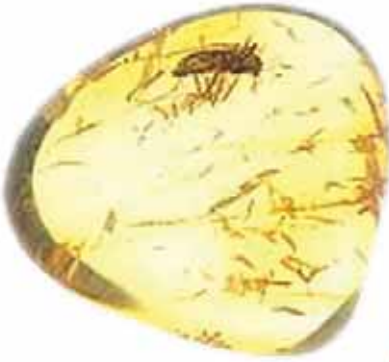
45 milyon yıllık sinek

www.Darwinistaldatmacaninincelikleri.com