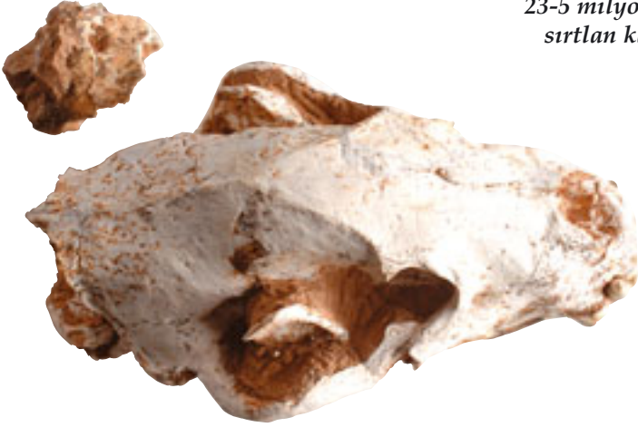
23-5 milyon yıllık sırtlan kafatası.

Darwinistlerin bilim dıřı iddialarına gre srngenler memelilerin de atasıdır. Ancak bu iki canlı sınıflaması arasında ok byk farklar vardır. Evrimciler bugne kadar bu konudaki sorulara tatmin edici tek bir bilimsel cevap verememiřlerdir. nk canlılar birbirlerinden deęiřerek var olmamiř, bir anda eksiksiz olarak yaratılmıřlardır.