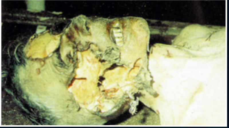
Mezarda böcekler tarafından yenmiş insan yüzü