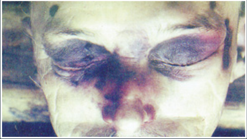
Ölümden sonra gözlerde meydana gelen morarmalar