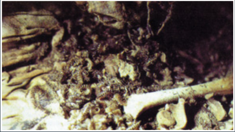
Mezardaki insandan arta kalan kemik parçaları