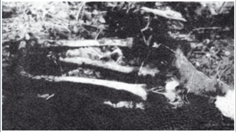
Mezardaki insandan arta kalan iskelet parçaları