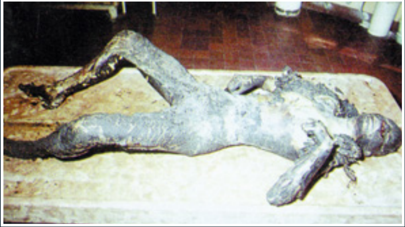
Yanarak ölmüş bir insanın resmi