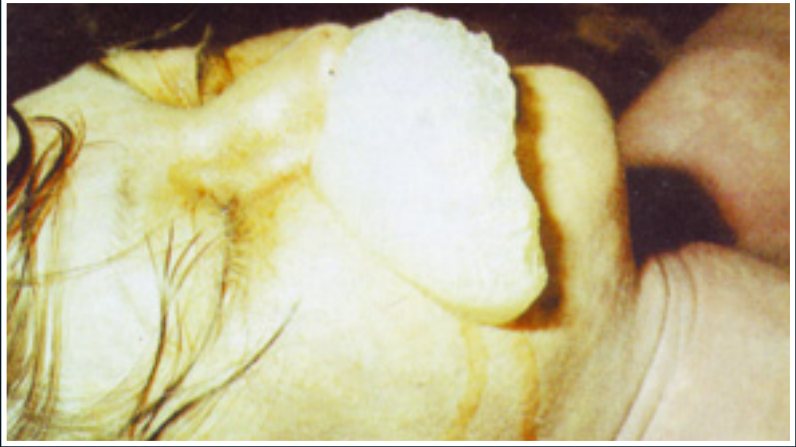
Ağızdan köpükler gelerek ölmüş bir insan